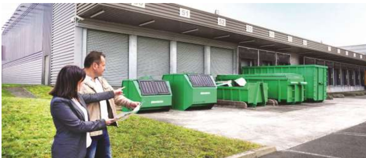
Le conseil aux entreprises avec la mise à disposition de contenants adaptés

Afin d'optimiser les performances économiques et écologiques des entreprises, le Groupe Brangeon apporte son expertise en matière de conseil pour la collecte, le tri et la valorisation des déchets. La diversité des contenants proposés permet de s'adapter à toutes les configurations chez le client pour favoriser le tri à la source . En complément de la mise en place des contenants, la cellule de conseil et d'assistance environnementale met à disposition une signalétique ainsi que des guides de tri adaptés à tous les types de déchets.