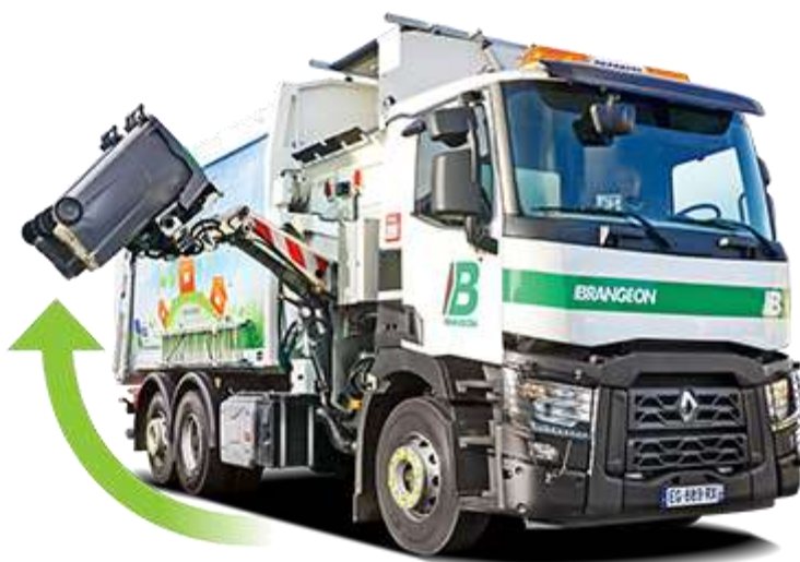
Benne d'ordures ménagères à préhension latérale