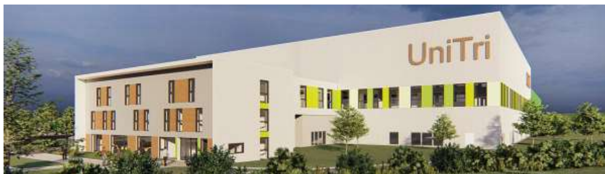
Le projet de centre de tri inter-régional UniTri

En 2023, l'entreprise exploitera un centre de tri inter-régional d'une capacité de 48 000 tonnes. Les déchets valorisables de plus d'un million d'habitants seront triés dans cette installation à la pointe de la technologie.