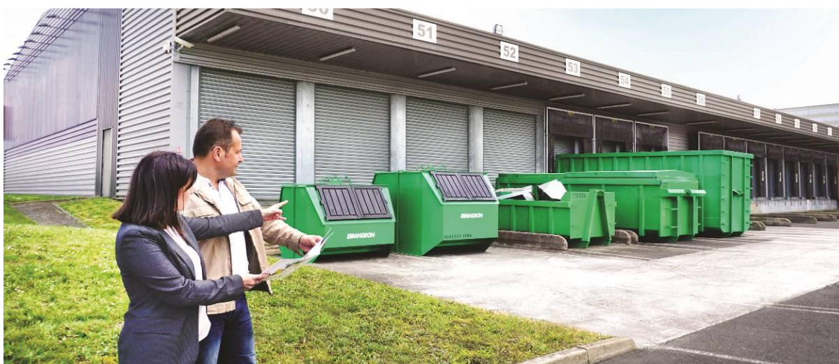
Le conseil aux entreprises avec la mise à disposition de contenants adaptés

Afin d'optimiser les performances économiques et écologiques des entreprises, le Groupe Brangeon apporte son expertise en matière de conseil pour la collecte, le tri et la valorisation des déchets. La diversité des contenants proposés permet de s'adapter à toutes les configurations pour favoriser le tri à la source chez le client. En complément de la mise en place des contenants, la cellule de conseil et d'assistance environnementale met à disposition une signalétique ainsi que des guides de tri adaptés à tous les types de déchets.